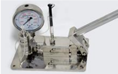
キャビティ付き手動式ポンプ