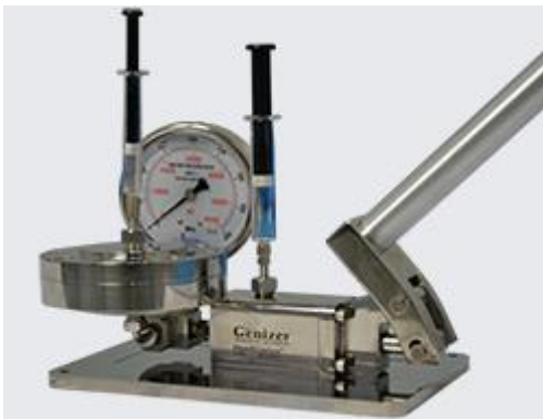
リポソーム押出機付き手動式ポンプ