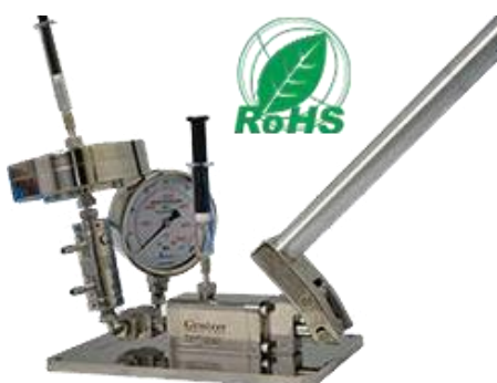
带挤出机的均质机