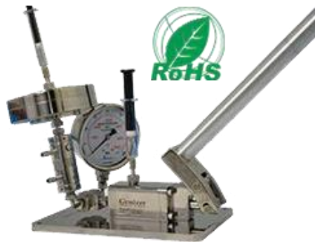
Homogen mit Extruder