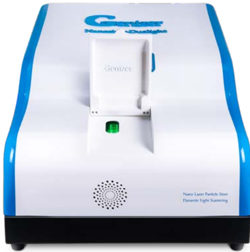
デュアルレーザーナノ粒子 サイズアナライザー